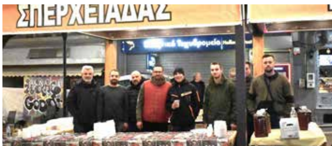
29/12/2023 - Οι παραδοσιακές "Γουρουνοχαρές" με άφθο-νες τσιγαρίθρες στην Κεντρική Πλατεία, από τον Κυ-νηγετικό Σύλλογο Σπερχειάδας και την συμμετοχή του Λαογραφικού Χορευτικού Ομίλου Σπερχειάδας.