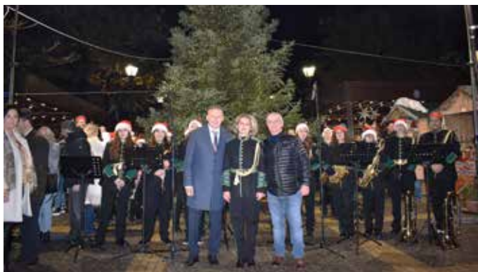
16/12/2023 - Φωταγώγηση του Χριστουγεννιάτικου Δέ-ντρου στην Κεντρική Πλατεία, με την συνοδεία χρι-στουγεννιάτικων μελωδιών από την Φιλαρμονική ορ-χήστρα Καρπενησίου.