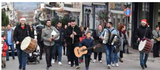
31/12/2023 - «Σπούρνια» Παραδοσιακά κάλαντα από τον Λαογραφικό Χορευτικό Όμιλο Σπερχειάδας ανηφορίζο-ντας την Κεντρική Λεωφόρο «Νικολάου Κρίκου» της Κοινότητας Σπερχειάδας, με την συνοδεία οργάνων.