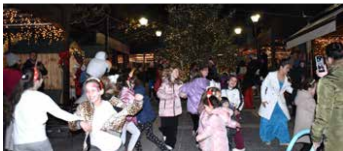
22-23/12/2023 - Χριστουγεννιάτικο Bazaar από τους Συλ-λόγους Γονέων και Κηδεμόνων του 1ου & 2ου Δημο-τικού Σχολείου, του Λυκείου και του Συλλόγου Γυναι-κών Σπερχειάδας στην Κεντρική Πλατεία, με δράσεις για τους μικρούς μας φίλους, πολύ παιχνίδι και χορό.