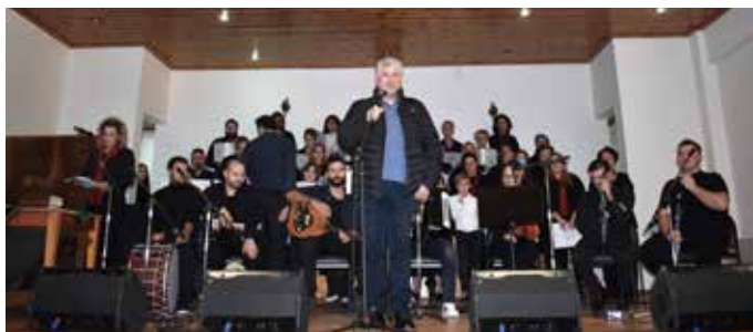
21/12/2023 - Χριστουγεννιάτικη εκδήλωση από το Παράρ-τημα Δυτικής Φθιώτιδας του Ωδείου "Γερμανός ο Με-λωδός" με τίτλο "Χριστούγεννα με τον Παπαδιαμάντη", στο Συνεδριακό Κέντρο Σπερχειάδας "Αθανασίου και Μαίρης Ακριδά".