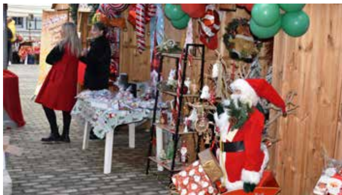
16-17/12/2023 - Χριστουγεννιάτικη Αγορά, σε συνεργασία με τον Εμπορικό και Βιοτεχνικό Σύλλογο Σπερχειάδας, φεστιβάλ σοκολάτας, δράσεις για παιδιά, street party και Ζωντανή Μουσική με τους ZERZELE PATIRTI.