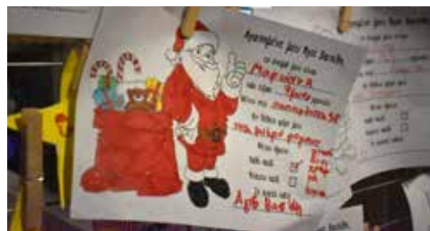
26/12/2023 - Η μαγική "Νύχτα των Ευχών" με χιλιάδες φαναράκια στον ουρανό και τους αγαπημένους μας "La Petit Marguerite" σε ένα μαγευτικό show σαπου-νόφουσας, φωτογραφίες με τον καρτιοθραύστη από τον Σύλλογο Νέων Σπερχειάδας, δωρεάν μπαλόνια παό τον Εμπορικό και Βιοτεχνικό Σύλλογο Σπερχειάδας, και τα σπιτάκια των ευχών από τον Λαογραφικό Χορευτικό όμιλο Σπερχειάδας και το Λύκειο Σπερχειάδας.