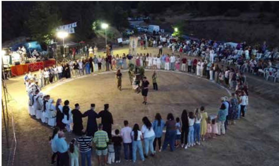
Είναι Η Άποψη Μου Π.Ν.