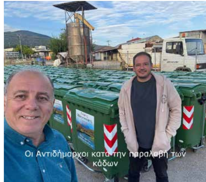
Οι Αντιδήμαρχοι κατά την παραλαβή των κάδων

“Η Κυβέρνηση θα εξακολουθεί να στηρίζει έμπρακτα τους Οργανισμούς Τοπικής Αυτοδιοίκησης στην κατεύθυνση της αποκατάστασης, στήριξης, και βελτίωσης των υποδομών τους.” σημειώνει ο κ. Σταϊκούρας