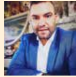
Από τον Βασίλη Ρήγα