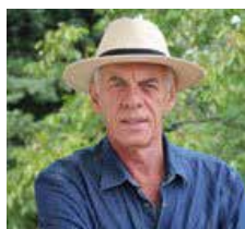
Γράφει ο Ηλ. Προβόπουλος

ΣΗΜΕΙΩΣΗ. Οι φωτογραφίες δανεικές από το διαδίκτυο.