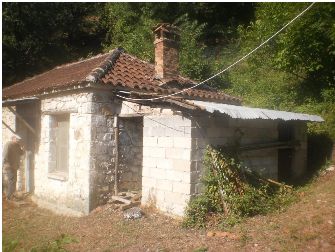
Άποψη παρακείμενου κτίσματος