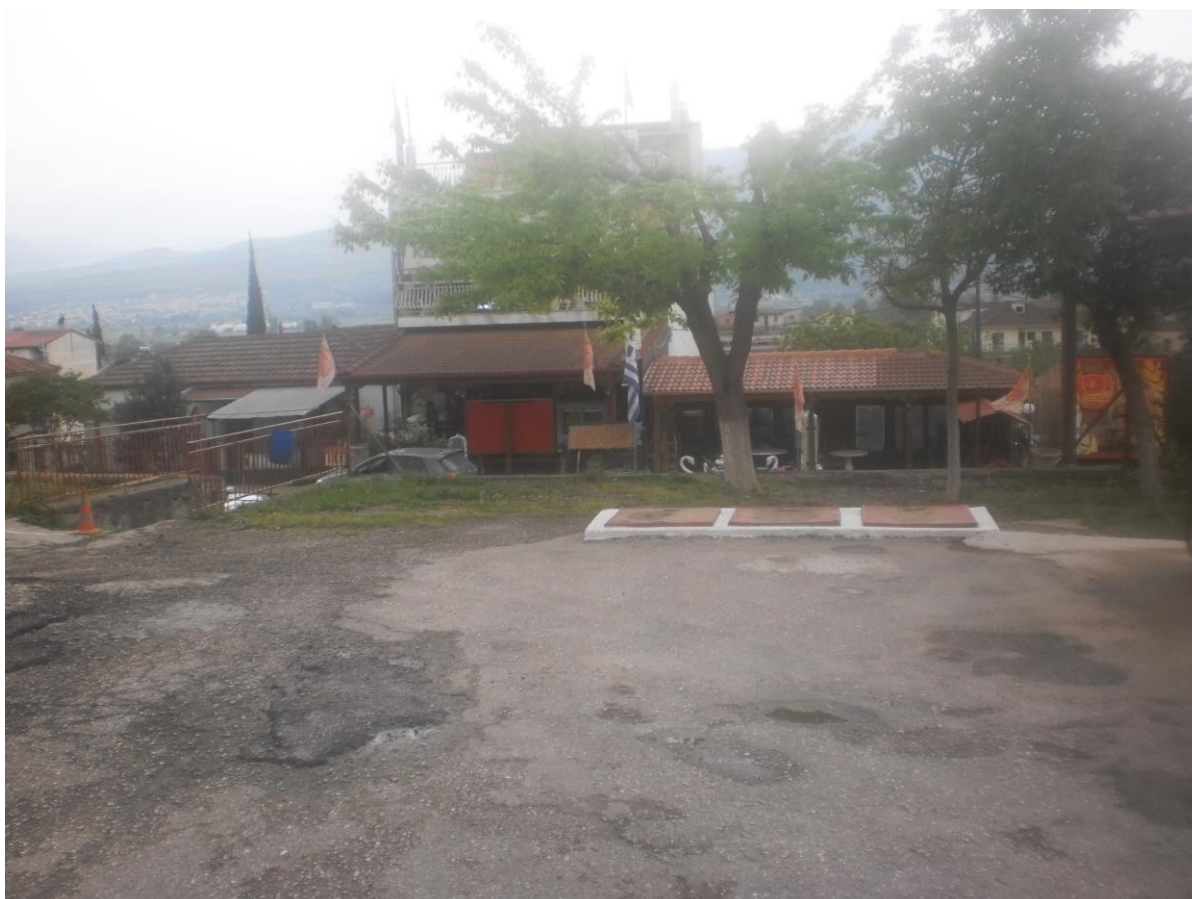
Περιβάλλον χώρος, εμπροσθεν κεντρικού κτιρίου (φωτ. 6)