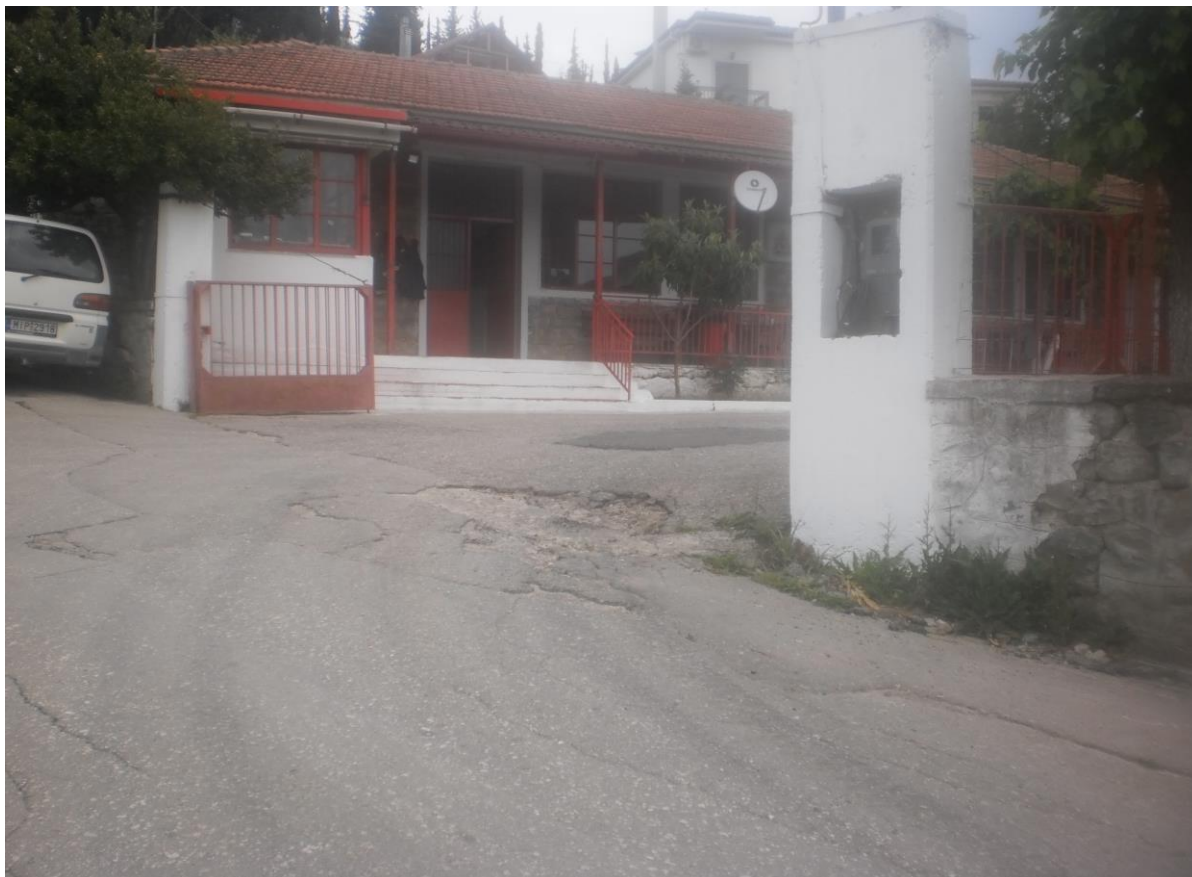
Είσοδος χώρου (φωτ. 5)