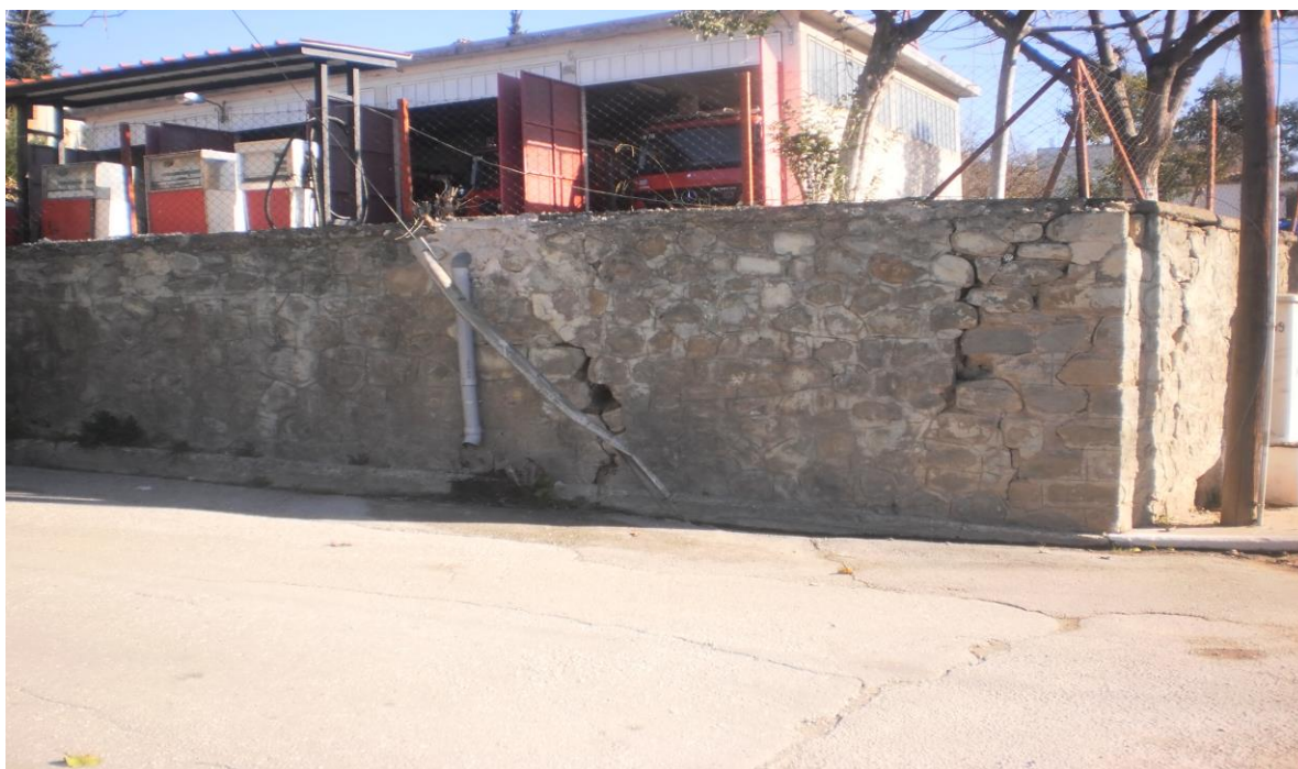
Τοιχείο περίφραξης προς καθαίρεση (φωτ. 1)