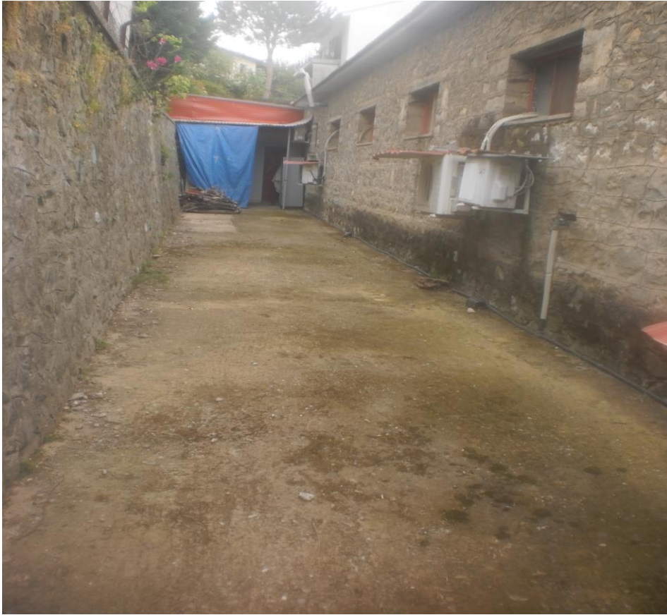
Ακάλυπτος χώρος όπισθεν κεντρικού κτιρίου (φωτ. 3)