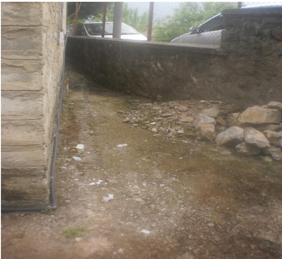
Ακάλυπτος χώρος όπισθεν κεντρικού κτιρίου (φωτ. 4)