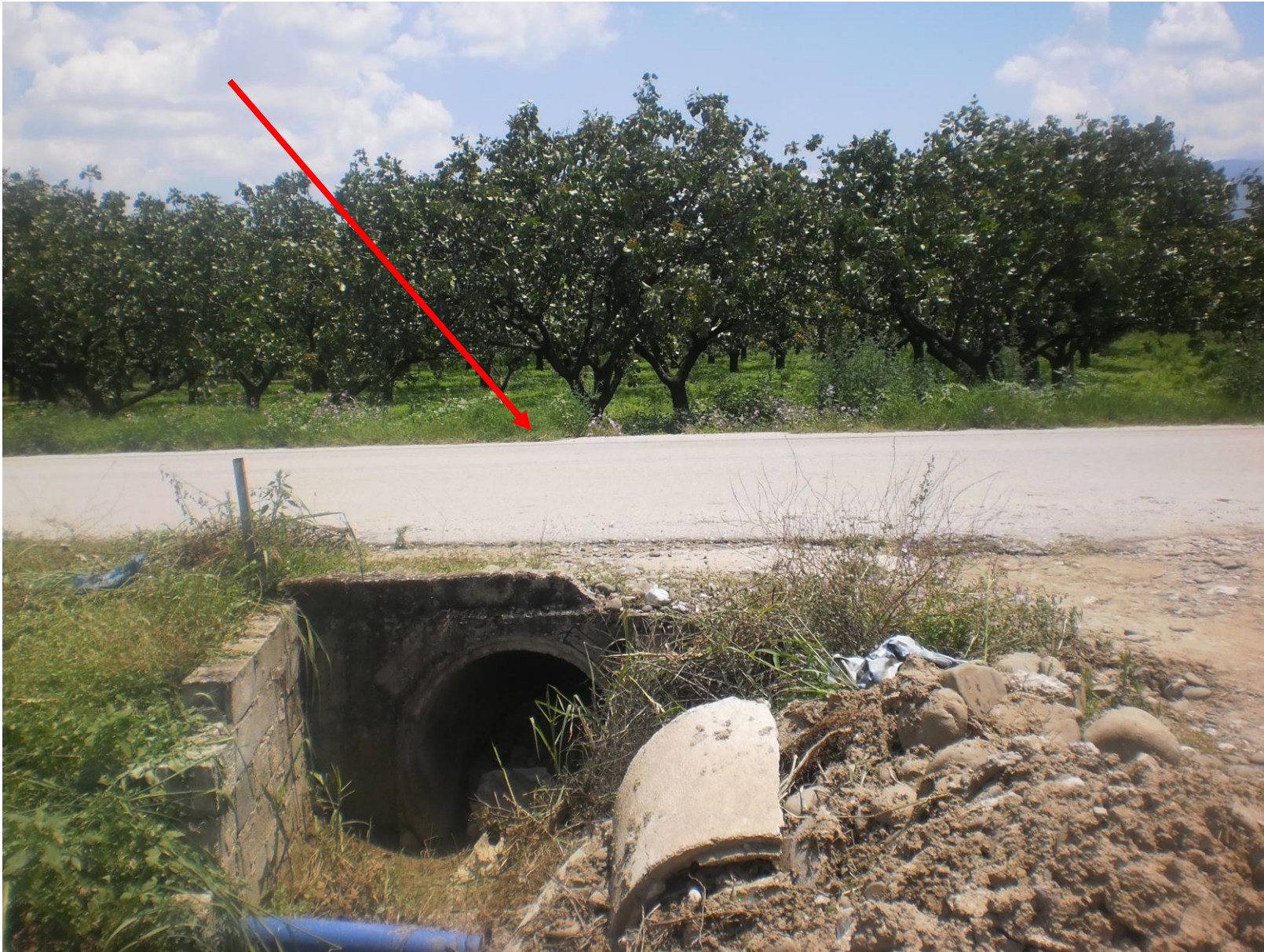
Φωτ. 2: Αρχή αντιπλημμυρικής τάφρου