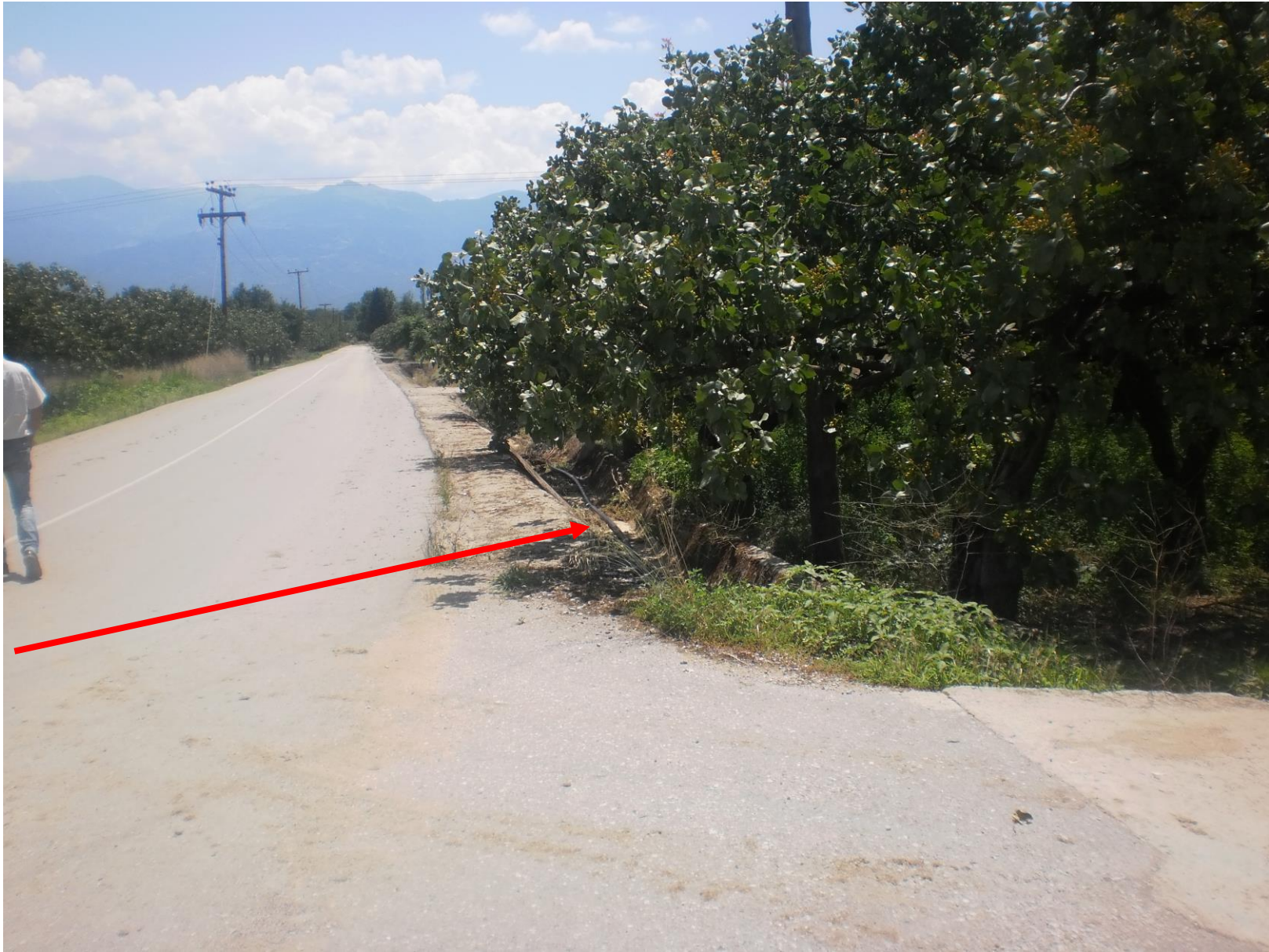
Φωτ. 5: Υπάρχουσα τάφος. Σημείο σύνδεσης νέας τάφρου.