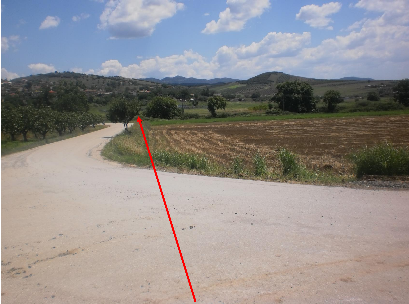
Φωτ. 3: Πέρασ τάφρου (ρέμα).