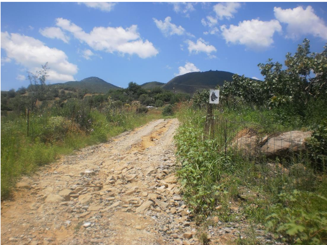
Φωτ. 2: Άποψη της οδού.