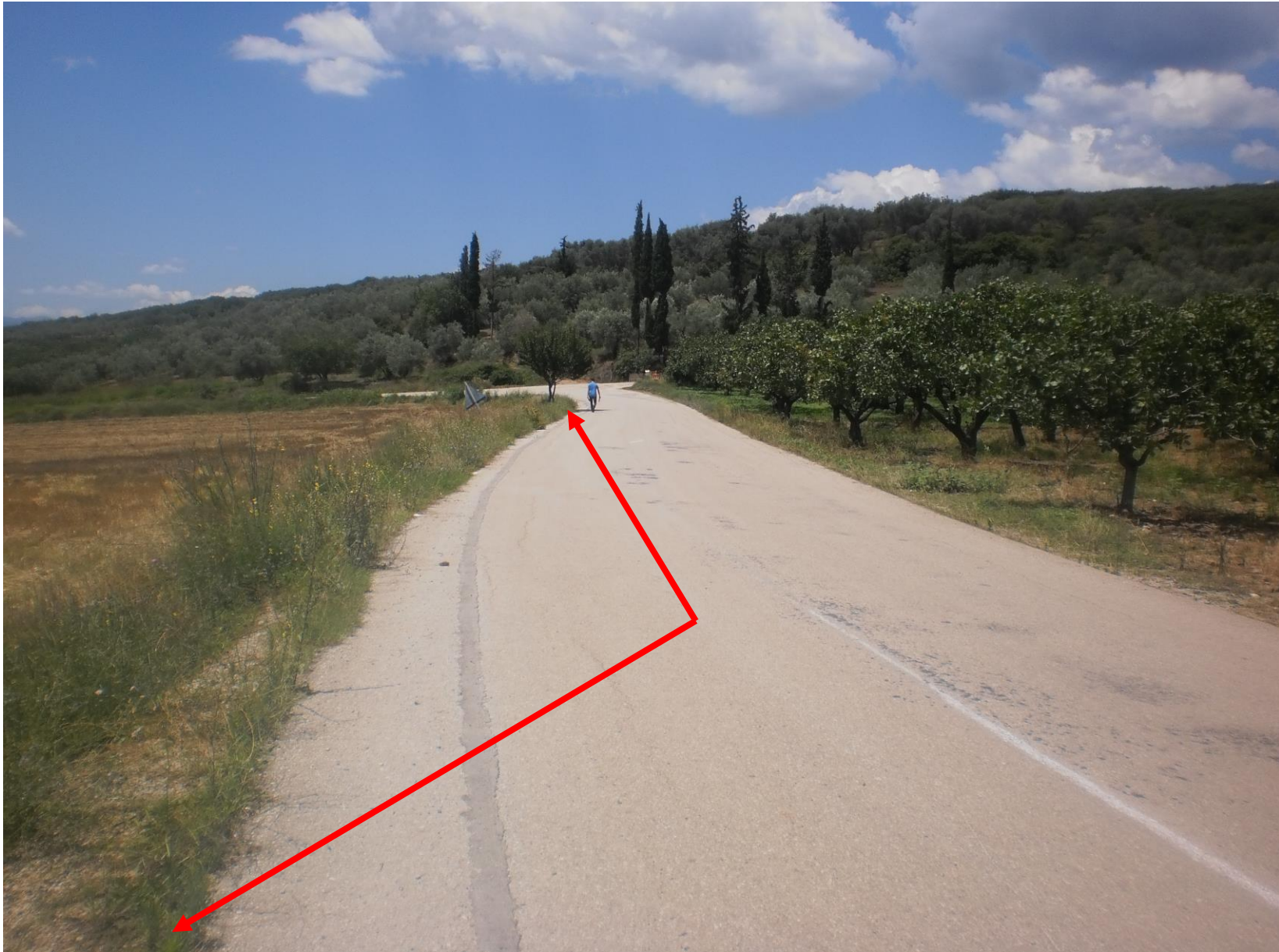
Φωτ. 2: Θέση κατασκευής αντιπλημμυρικής τάφρου.