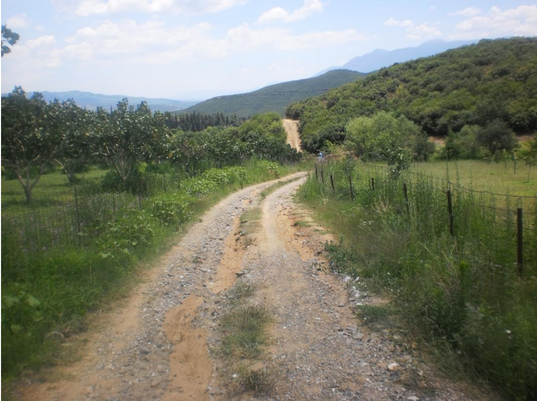
Φωτ. 1: Άποψη της οδού.

3) Στην Τοπική Κοινότητα Πλατυστόμου, έχει καταστραφεί σε μεγάλο βαθμό λόγω των έντονων βροχοπτώσεων, ο αγροτικός δρόμος που οδηγεί σε πληθώρα καλλιεργειών (κυρίως φυσιτικής) και αγροικίες (προς θέση "Θερμά"). Προτείνεται η τσιμεντόστρωση, μέσου πάχους 12εκ., τμήματος 450μ., μέσου πλάτους 2,80μ., στο οποίο παρατηρείται η μεγαλύτερη καταστροφή, με σκυρόδεμα C30/37 ελαφρώς οπλισμένο με δομικό πλέγμα T131, για την οριστική επίλυση του προβλήματος. Θα απαιτηθεί σε ορισμένα σημεία, διαμόρφωση του δρόμου με κατάλληλο μηχανήμα.