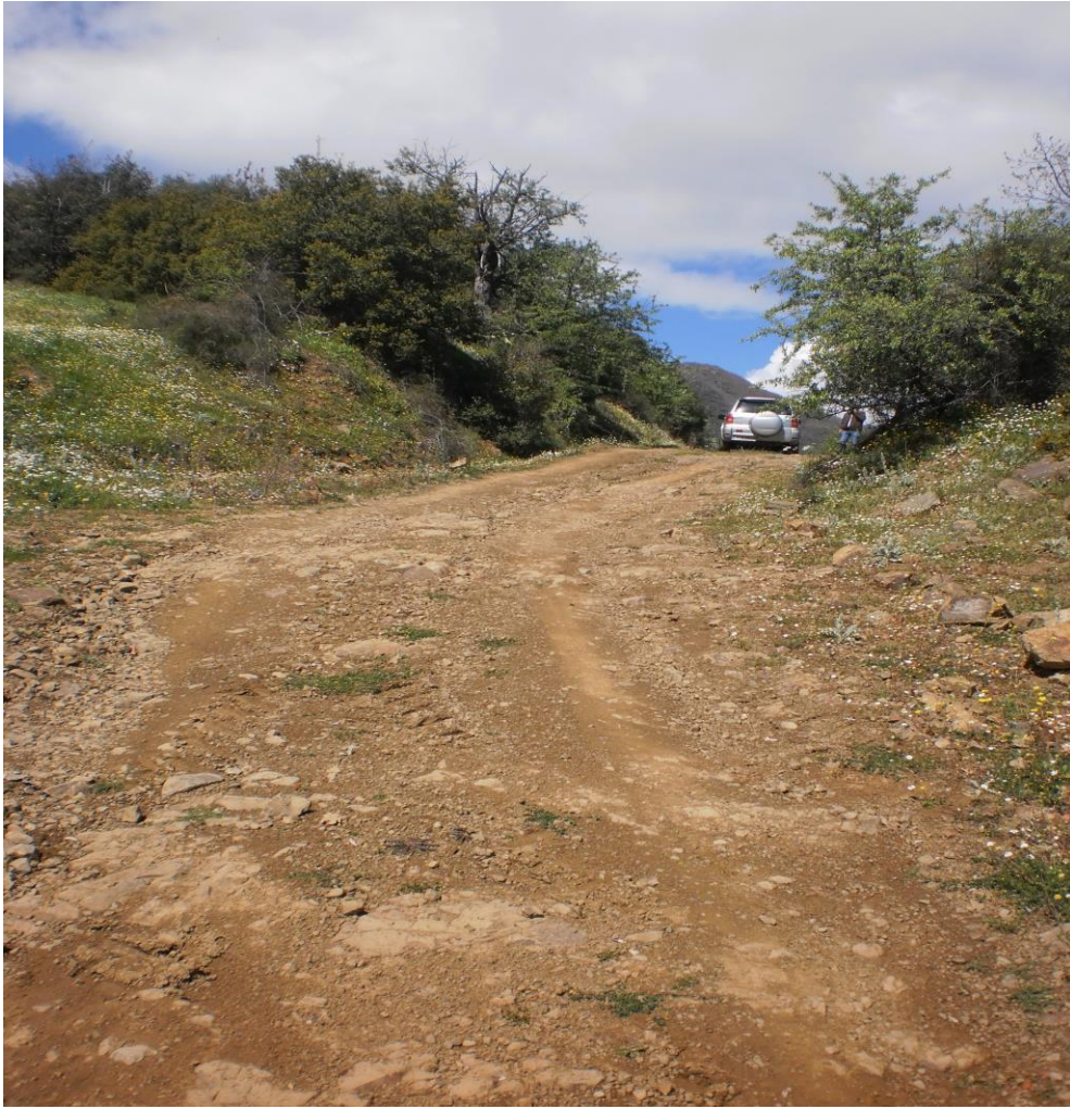
Φωτ. 3: Άποψη της οδού