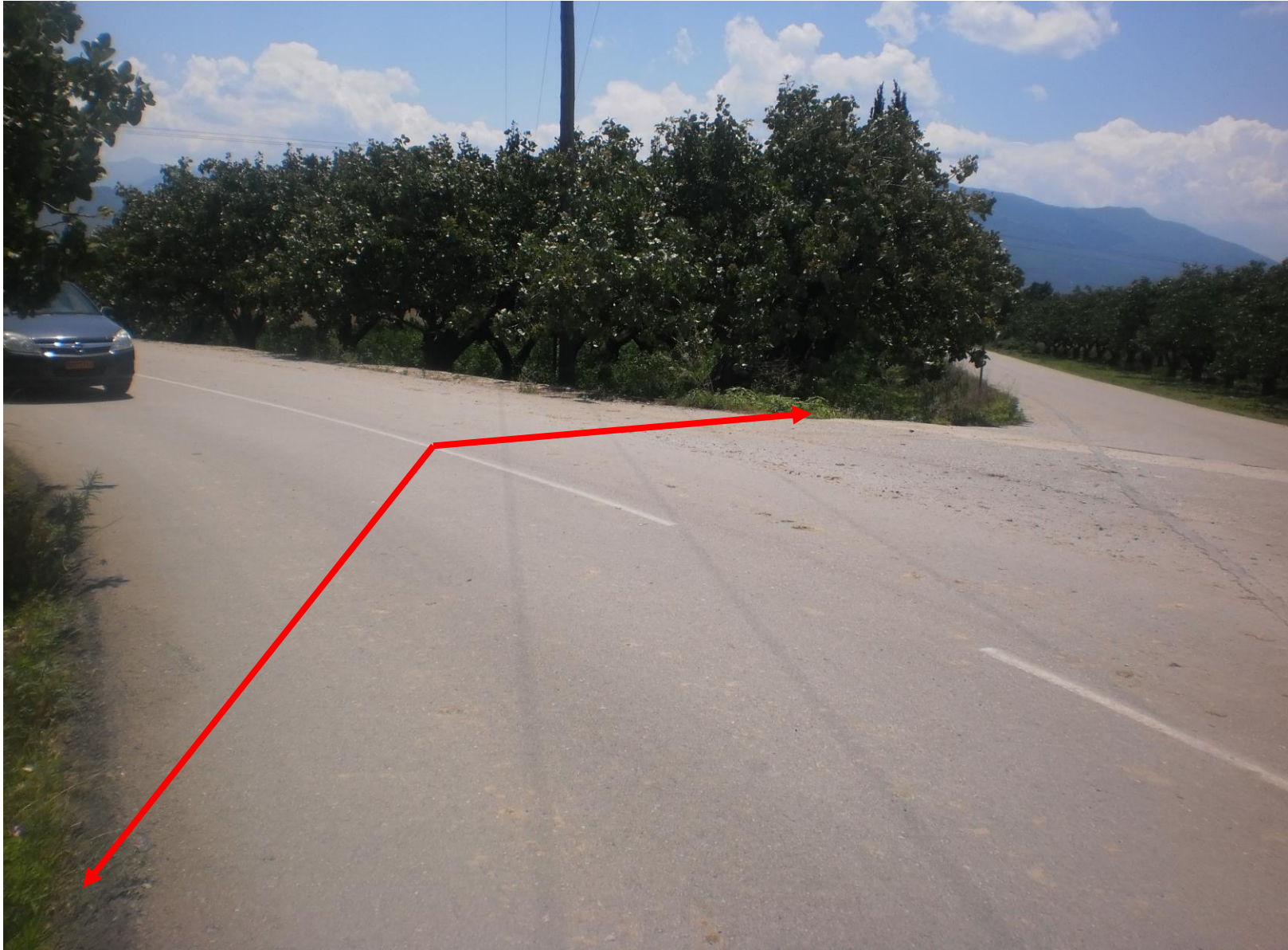
Φωτ. 4: Σημείο σύνδεσης με υπάρχουσα αντιπλημμυρική τάφρο. Διέλευση με σωληνωτό υπό του ασφαλτοστρωμένου δρόμου.