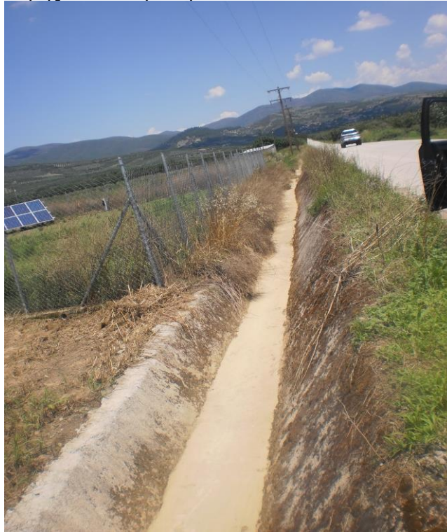
Φωτ. 1: Υφιστάμενη τάφρος

1) Στις Τοπικές Κοινότητες Αρχανίου και Μάκρης, οι οποίες γειτνιάζουν, υφίσταται τάφρος σε τμήμα της ασφαλτοστρωμένης οδού που συνδέει τις δύο κοινότητες. Η υφιστάμενη τάφρος (φωτ. 1) είναι τραπεζοειδούς ανοικτής διατομής από σκυρόδεμα.