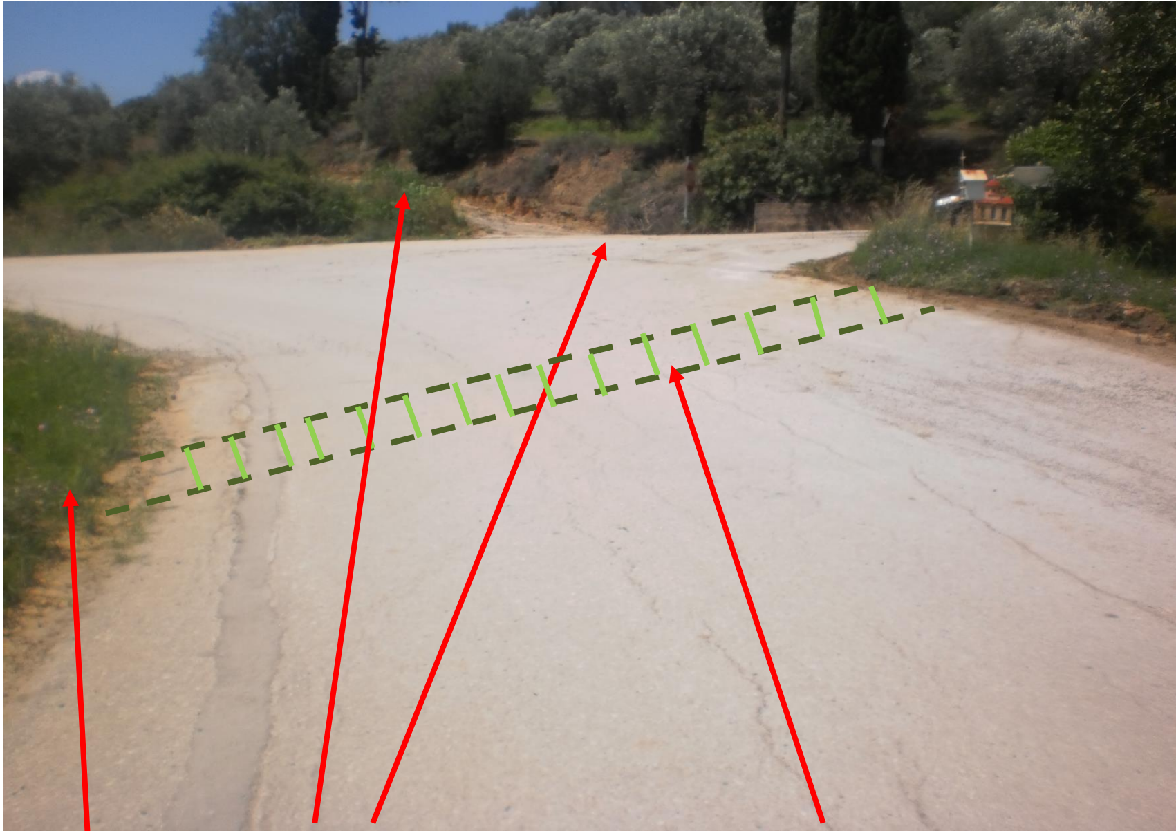
Φωτ. 1: Συγκέντρωση φερτών υλών στα ανάντι του δρόμου. Συλλεκτήρια σχάρα για συγκέντρωση υδάτων. Σημείο έναρξης τάφρου. Τσιμεντόστρωση κατωφέρειας.