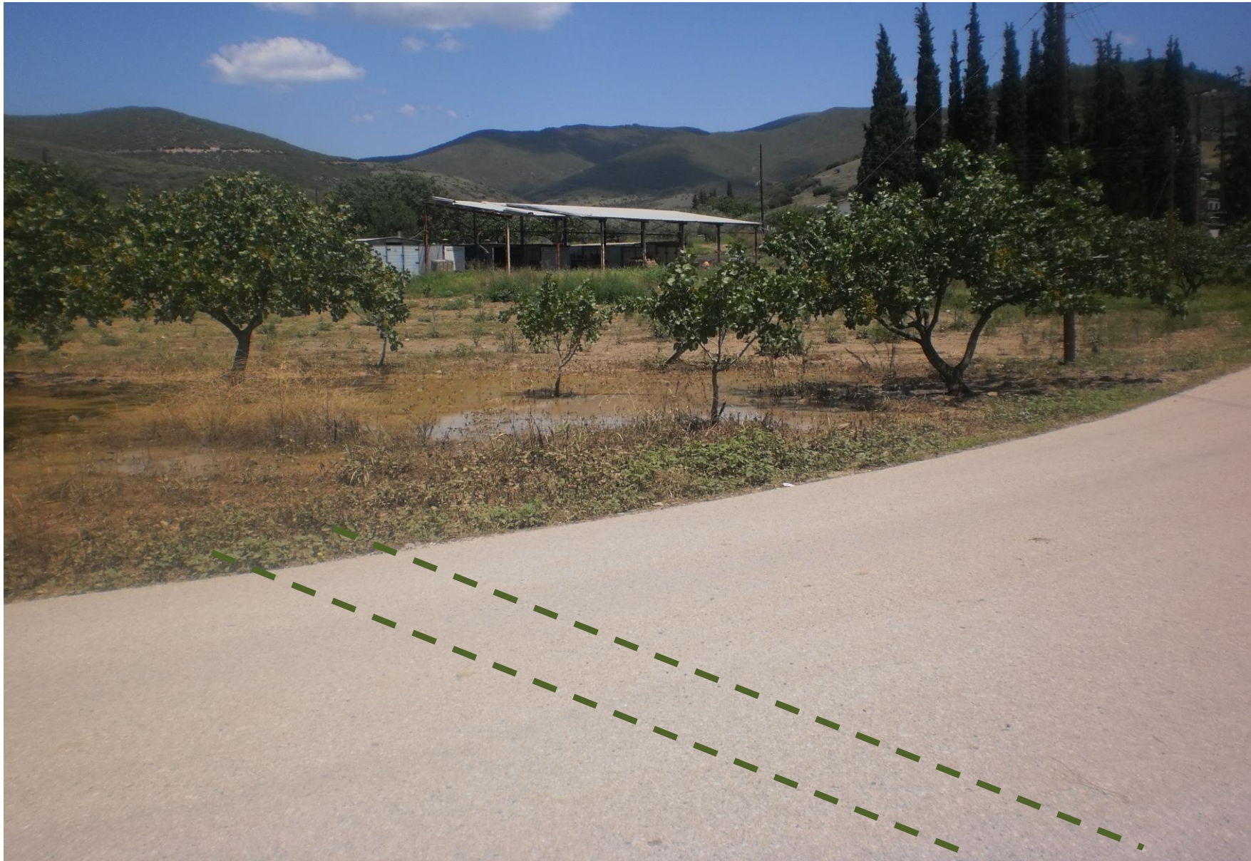
Φωτ. 4: Θέση σωληνωτού αγωγού Φ1000.